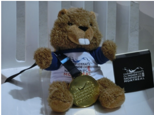
メダルと副賞のビーバー